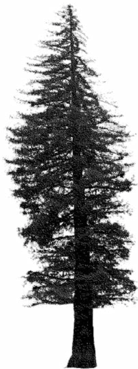
Séquoia de Vals